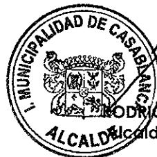
RODRIGO MARTINEZ ROCA Alcalde de Casablanca